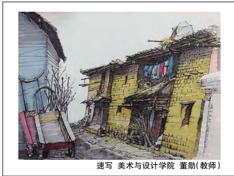
速写 美术与设计学院 董勤(教师)