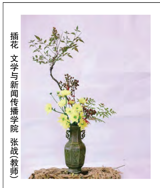
插花 文学与新闻传播学院 张战(教师)

来是前人的艰苦奠基让我们有了今天的位置。罗星塔公园不仅风景秀丽,而且地理位置重要,正如牌楼上的对联所提:拔地摩天不愧闽江锁钥,环山抱水堪称东海明珠。闽江上的船舰让我们流连忘返,但到了傍晚时分,我们便告别了马尾的船政文化景区,准备去久负盛名的三坊七巷吃晚饭。到了三坊七巷,这里果然坊巷纵横,石板铺地,白墙黛瓦,充满了古意。街边有几间日式餐厅,陈设和装饰都非常地讲究。街道拐角处有一家“边境渔场”,还有一家“深海烤鱼”,都是吃海鱼的地方。这里照射着蓝的和绿的灯光,营造出一种海洋的色调。我们在“深海烤鱼”要了一条鲷鱼,肉质非常鲜嫩。待餐的时候,一位金发女郎伴着音乐在门口唱起了慵懒的爵士歌曲;菜上桌了,她又唱了几首我们熟悉的流行音乐。枕着水流,夜色迷蒙,在柔和灯光的沐浴下,吃着美食,还有现场音乐的陪伴,不能不说是极惬意的闲暇时光。吃完饭,不知怎么就荡到了一条年轻人最爱的街道。在水声潺潺的安泰河两岸,灯光幽美、古色古香的建筑里经营着各种咖啡馆、酒馆、烧烤夜宵店、音乐餐厅和民谣酒吧等等。河道两岸垂柳掩映,围栏上灯光映照,美轮美奂,宛若仙境。每隔一段距离,就有一座拱桥连接河道两岸,十分便于观赏游览。澳门桥边,榕树葱茏,红花娇艳,旁边的古屋贴有门联,上联:几点梅花几点雨,下联:半含冬景半含春。一圈转下来,我们看见许多年轻人三五成群地,或者围着桌子喝咖啡聊天,又或者边饮边谈边快朵颐,或者在酒吧里飞扬青春。后来我们还爬了鼓山,发现佛教曾经在福州极为盛行,我们还看到老人们焚香虔诚地跪拜榕树。我们在很多地方看到“佛跳墙”三个字,很好奇,以为是一种玩具,我们问过之后,才知道是福州的一道名菜。于是我们专门找了一家饭店点了这道菜,店家说要事先预约,而且做这道菜还要花三四十分钟,我们就作了罢。离开福州的那天,朋友驱车带我们到闽江边观光。当时和风舒畅,晴空万里,道旁的树上开满了鲜艳的小红花,滨江公园里游人三三两两,尽情地享受着这宏远、美丽的滨江风光。放眼望去,远处的江面瓦蓝如黛,近处的江面金波粼粼,江面上行船点点,宛如画中;极目远眺,幢幢高楼拔地而起,青山白云天边交合。面对此情此景,心中诗意萌生:苏幕遮·福州 艳阳高,和风畅。芳草如烟,烟笼江波漾。遥望青山苍苍莽,此地河山,自占蒙德里。慕名儒,杨桥巷。船政学堂,孕育新军将。最是林公当景仰,取义别妻,血洒黄花岗。