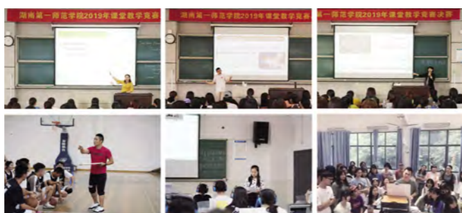
教师充分开展了案例式、探究式和参与式教学,循循善

我校课堂教学竞赛自四月初启动,历时两个月。在院级初赛中脱颖而出教师被推荐参加校级决赛,其中11名教师为副教授,约占决赛总人数的三分之一。决赛分文科、理科、艺体三组进行,参赛