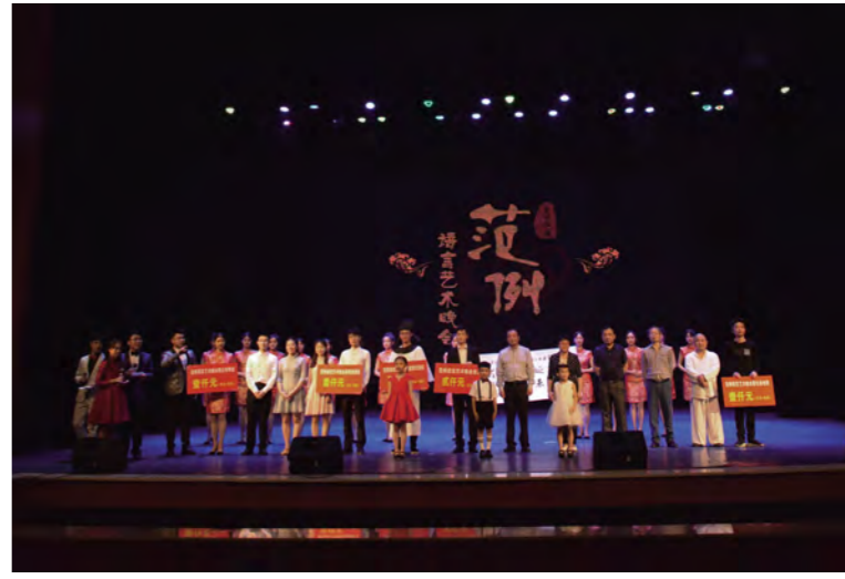
晚会微博话题量高达120万次,位列当日全国教育排行榜第一。

经专业评审和大众评审投票,情景剧《聂耳小提琴的前世传奇》喜获范例语言艺术金奖,演唱《将进酒》获最受欢迎奖,朗诵《驼峰之魂》获最具潜质奖,相声《星城趣闻》获最佳原创奖。观众们在语言艺术的熏陶中激动了心灵,提升了境界。据统计,