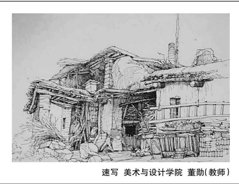
速写 美术与设计学院 董勋(教师)

直到2014年夏初,一通电话带来了一个天大的坏消息——我再也没有机会可以吃到外婆的味道了。现在我只能记得舅舅在电话里沉声说:“外婆……不行了。”我一瞬间懵了反应不过来,想动一下却发现好像控制不了自己的身体。我匆匆忙忙和妈妈收拾行李赶回老家,一踏进大门就看见全身湿透的外婆直直的躺在木板上。我一下子被吓傻了,呆愣愣地跟着大人们跪下,不敢相信她就是我的外婆。明明前两天才和她打了电话,还说今年又要收稻谷了。后来葬礼时才知道,外婆是为了开水闸灌田,才会失足跌入