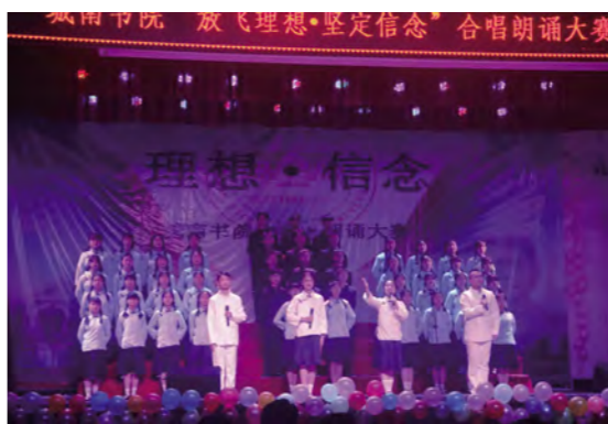
春风吹波浪》从改编的歌声中透出坚定的信念,深情的演绎感染了全场观众;820音

决赛在846科教班《中国有了不起的青年》表演中拉开帷幕,819音乐班演唱的《母亲的微笑》饱含深情,温柔细腻的歌声获得满堂喝彩;830中文班同学手持飞扬的鲜红旗帜,铿锵有力的朗诵牵引着现场观众们的心;795思政班《改革